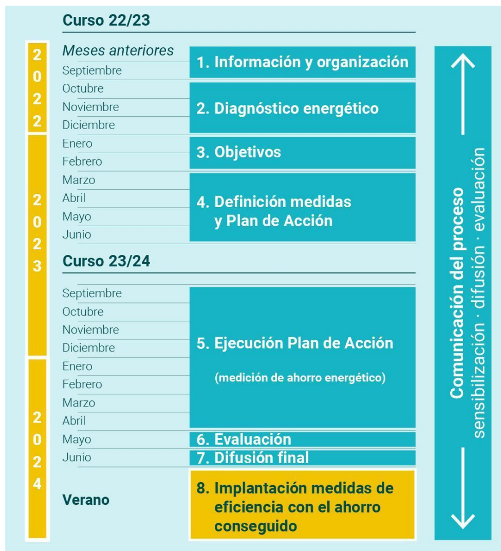
Figura 4. Cronograma del proceso Manza50/50. (Traza)

Hasta ahora, el proceso ha consistido en lo siguiente: