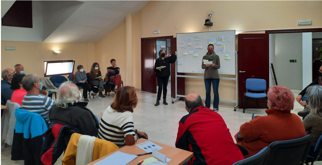
Figura 10. Taller de problemas y deseos, Abril 2022. (Traza)

la regulación de Comunidades Energéticas en España, entre otros. Se dibujaron caminos para conectar con ideales, ilusiones, y afecciones de la gente, de cara afrontar la iniciativa vecinal-municipal.