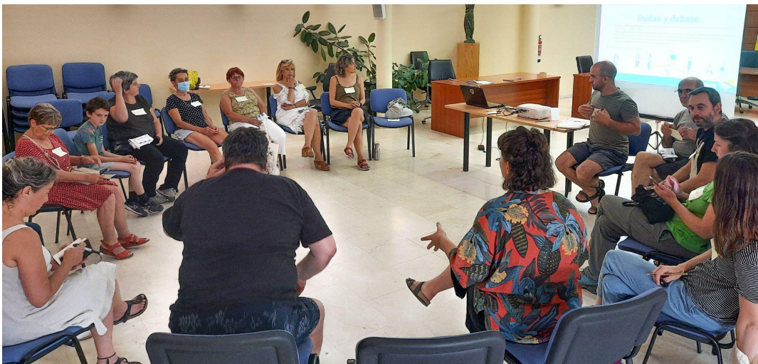
Figura 11. Taller Crear Comunidad, Junio 2022. (Traza)