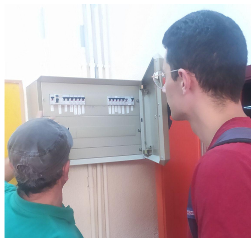
Figura 7. Recorrido energético por las instalaciones del centro con el Equipo Energético de profesorado, Septiembre 2022. (Colegio Virgen de Peña Sacra)