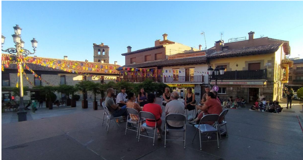
Figura 12. Taller del grupo motor de la Comunidad Energética, Septiembre 2022. (Traza)