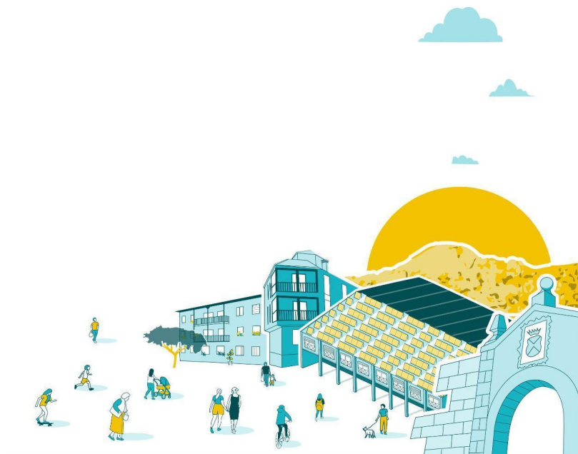
Figura 1. Descripción gráfica del proyecto. (Traza Territorio)

Uno de los pilotos en España es ManzaEnergía, en el municipio madrileño de Manzanares el Real. Esta Comunidad Energética, impulsada por el Ayuntamiento, 2 cuenta con aprendizajes en relación al rol de los gobiernos locales, la implicación de personas diversas y el uso de tecnologías para fomentar el autoconsumo colectivo en España. Consiste en la instalación de paneles solares en el polideportivo municipal para ceder la energía al propio polideportivo, el colegio público, 15 hogares en situación de vulnerabilidad energética, y alrededor de 40 vecinos y vecinas del pueblo. Para ello, se está trabajando en un ambicioso proceso participativo de sensibilización con el protagonismo de la comunidad educativa, y la creación de una asociación vecinal para la autogestión de la Comunidad Energética.