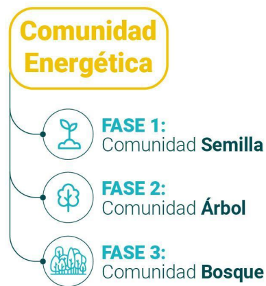
Figura 8. Fases de la Comunidad Energética. (Traza)

La formalización de ManzaEnergía tiene lugar a través de la constitución de una asociación para vehicular las diferentes iniciativas vecinales relacionadas con la energía, la movilidad sostenible y el cambio climático. Como objetivos principales están la reducción de la factura eléctrica, contribuir a la transición ecológica mediante el consumo de energía renovable de proximidad y empoderar a la ciudadanía en sus decisiones y en relación con el sector energético. Para ello, la Comunidad Vecinal de Energía se desarrolla en tres fases: