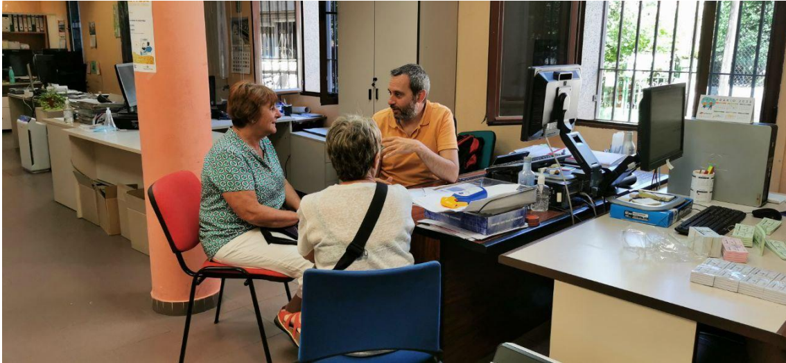
Figura 3. Fotografía de una atención de la oficina energética.

hogar medio pasó de pagar unos 40 € mensuales en febrero del 2021 a 131 € en el mismo mes del 2022. En algunos casos este salto en la factura puede llegar hasta los 165 € al mes.