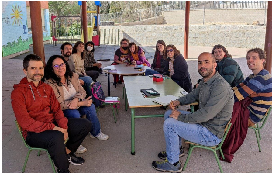
Figura 5. Fotografía de un encuentro con el grupo motor de profesorado, Octubre 2021. (Colegio Peña Sacra)