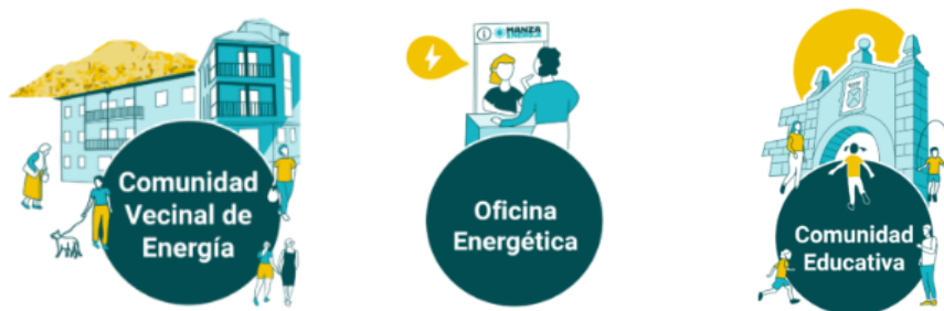
Figura 2. Pilares de ManzaEnergía. (Traza Territorio)